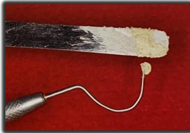
Figura 1 – forma correta de prescrever a receita do pó da pasta CTZ