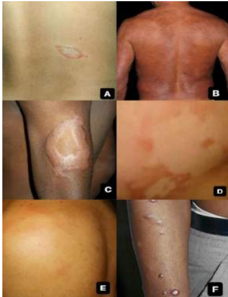
Figura 3: Hanseníase tuberculóide (A), hanseníase virchowiana (B), hanseníase dimorfa-tuberculóide (C), hanseníase dimorfa (D), hanseníase dimorfa- virchowiana (E) e hanseníase históide

organismo, resultando em lesões cutâneas difusas, nodulares e infiltradas. Nesse contexto, pode ser afetada uma parte generosa do tecido, como o nariz, os rins, e os testículos. Os indivíduos infectados podem apresentar placas cutâneas, máculas, pápulas ou nódulos, que muitas vezes se manifestam de forma simétrica. Dessa maneira, a pele pode apresentar uma aparência leonina, com engrossamento e com consideráveis alterações de pigmentação. Além disso, os nervos periféricos são amplamente afetados, podendo levar a deformidades, perda de sensibilidade que pode ser permanente e fraqueza muscular (Figura 3) (BRAGHIROLI, 2019).