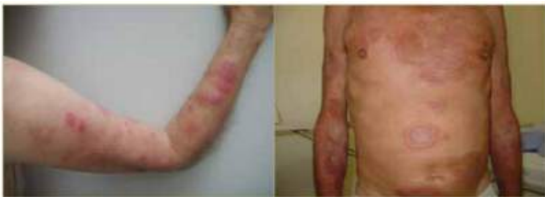
Figura 2: Reações tipo 2

Já as reações tipo 2 são caracterizadas pelo aparecimento de nódulos dolorosos e avermelhados sob a pele, e esses nódulos podem ocorrer em áreas afetadas pela hanseníase ou em outras partes do corpo. Além disso, outros sintomas como febre, mal-estar, dores articulares e musculares podem acompanhar as reações tipo 2 (Figura 2) (SOUZA, 2023).