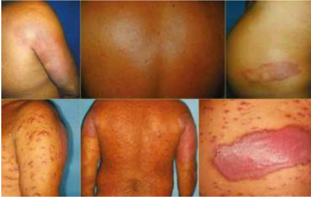
Figura 1: Reações tipo 1.

As reações tipo 1 ocorrem quando há uma intensificação da resposta imunológica contra as bactérias da hanseníase, e isso pode resultar em inflamação e inchaço das lesões existentes, bem como o surgimento de novas lesões. Os sintomas comuns incluem vermelhidão, dor, sensibilidade e aumento da sensibilidade ao toque ou calor, e em alguns casos, pode haver complicações, como neurites (inflamação dos nervos), que podem levar a danos nos nervos e perda de sensibilidade (Figura 1) (SILVA, 2020).