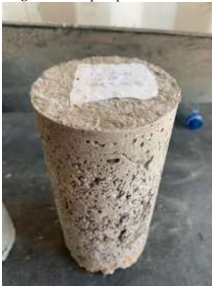
Figura 03: corpo e prova 03

Os corpos de prova 03 apresentaram as menores resistências dentre as amostras. Pode-se notar pela Figura 03 que o corpo de prova feito com pó de brita apresenta um aspecto mais poroso.