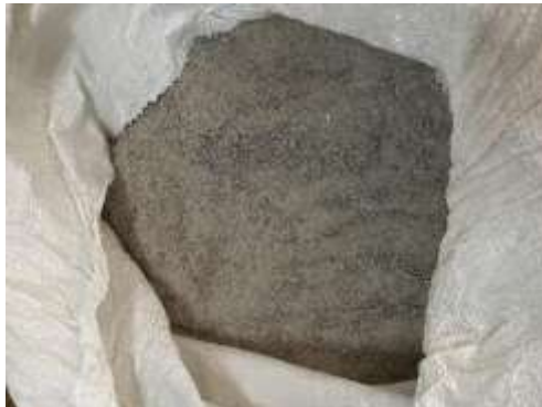
Figura 1: Pó de Brita

granulometria inferior a 0,075 mm e passa na peneira 200, sua grandeza é da mesma ordem do cimento. Esse material pode nos trazer ganhos de resistência e impermeabilidade, devido seu melhor empacotamento do concreto, preenchendo os vazios. (MENOSSI, 2004).