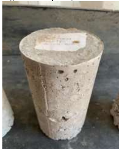
Figura 02: corpo de prova 02

A Figura 02 apresentará abaixo o corpo de prova 2 e evidenciará o seu aspecto do corpo de prova feito com areia e pó de brita.