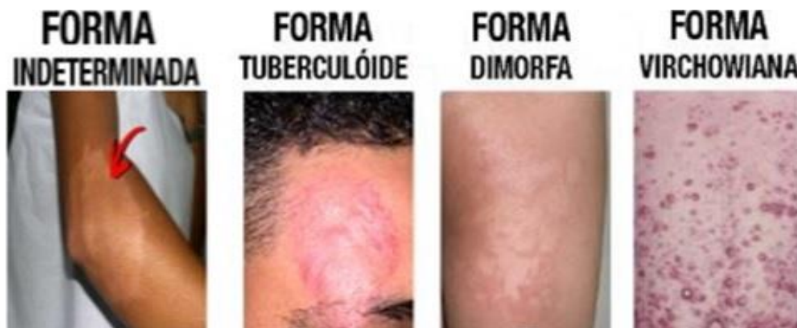
Figura 2: Formas da hanseníase se manifestar na pele

O outro modo, existem as multibacilares casos mais graves e com alta presença de bacilo no organismo do indivíduo, nesta situação o organismo do paciente não apresenta resistência ao bacilo, permitindo assim que o mesmo se multiplique e se externe, causando a transmissão da patologia, além disso a mesma tem capacidade de provocar até 5 categorias de lesões, se não tratada pode acarretar a invalidez da pessoa ou indivíduo. Deste modo, fica identificado a necessidade de correto diagnóstico para que seja escolhido o tratamento mais eficaz para o paciente (FORTUNA et al., 2018; LIMA et al., 2019; TAVARES et al., 2013).