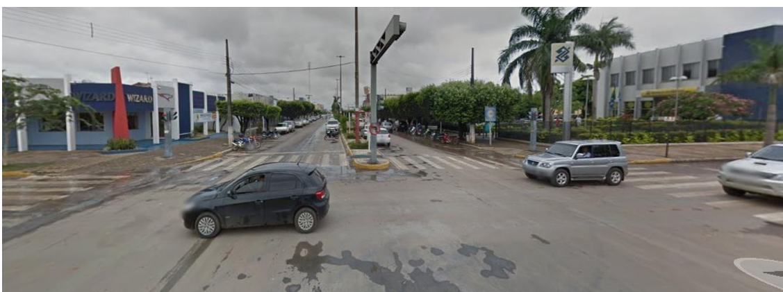
Figura 9: Avenida Júlio Campos

De Angelis (2000) ainda ressalta que praças são conexões entre os diversos espaços criados, de modo que as praças tinham noção de “espaços” em que se vivenciava a infância, a adolescência, “qualquer um de nós tem, distante que sejam, lembranças de uma praça onde, na infância, o balanço, a gangorra ou o escorregador fizeram parte da vida da criança.”