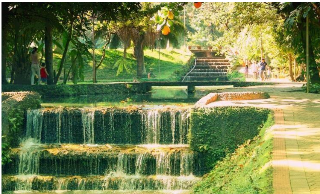
Figura 13: Parque do bosque dos buritis Goiânia - GO

Pessoas que trabalham na região usam o parque como refúgio no horário do almoço ou para dar uma pausa na correria do dia-a-dia. Além disso, ele serve como ponto de lazer para famílias ou para quem apenas quer dar uma volta com seu pet. No parque existem diversos tipos de plantas e árvores, como o Bambu, Bacuri, Flamboyant, Buriti, Ipê, Jambo entre outras.