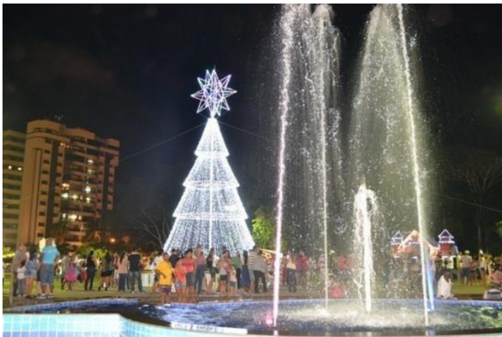
Figura 6: Praça da Bíblia, Sinop-MT