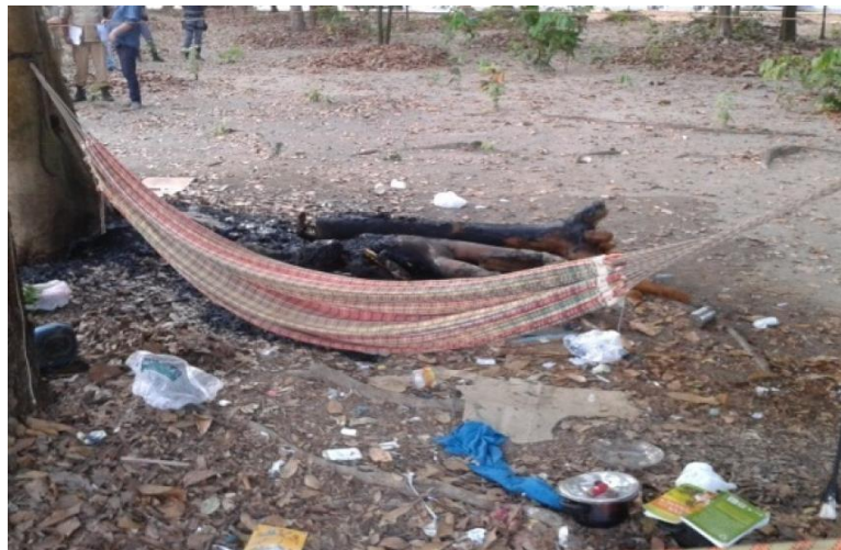
Figura 10: mulher é queimada viva na praça da Bíblia

prostituição, restando para pequena parcela da sociedade alternativas de lazer, meditação, dentre outras atribuições relativas a este setor público que pertence a toda sociedade. (SANTOS, 1997).