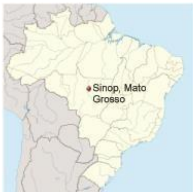
Figura 5: localização da cidade de Sinop no mapa de Mato Grosso

Em poucos anos após sua fundação, Sinop foi alcançando autonomia política, e cidades em seu entorno passaram a fazer parte da mesma. No ano de 1982 foi eleito o primeiro prefeito de Sinop. O Urbanismo e o plano diretor com população atual com mais de 130 mil habitantes segundo IBGE, Sinop é considerada uma cidade planejada, com critérios modernos sendo seu traçado irregular e suas quadras por mais de quatrocentos quilômetros de ruas e avenidas. Possuindo também 27,00 m 2 de área verde por pessoa (a ONU recomenda 12,00 m 2 /habitante, no mínimo).