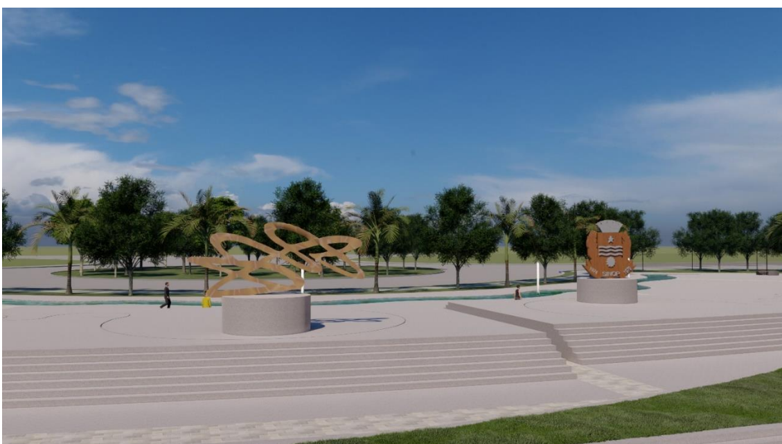
Figura 26: Espaço para contemplação com esculturas

Figura 26, um dos espaços para contemplação com iluminação embutida e esculturas, contendo escadas e rampas nas extremidades.