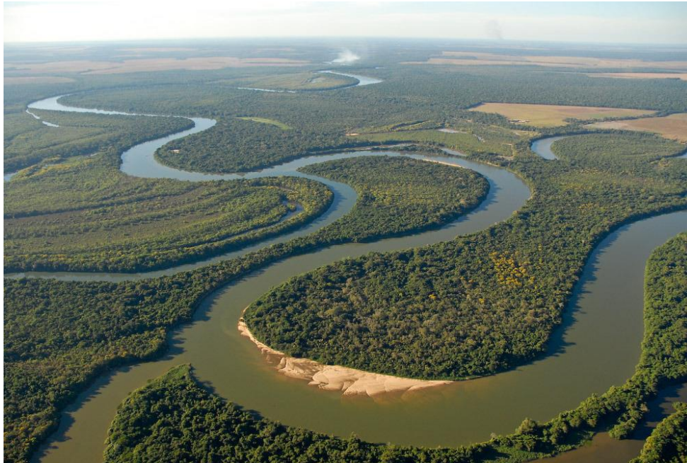
Figura 16: Rio Teles Pires