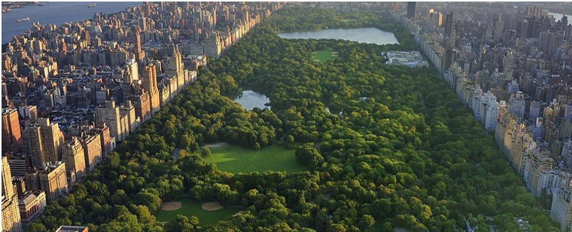
Figura 4: Central Park

Lombardo (1985), fala também que quanto maior a vegetação, mais ela influencia no quesito energia, a partir da necessidade das plantas de absorção do calor por questão dos processos vitais.