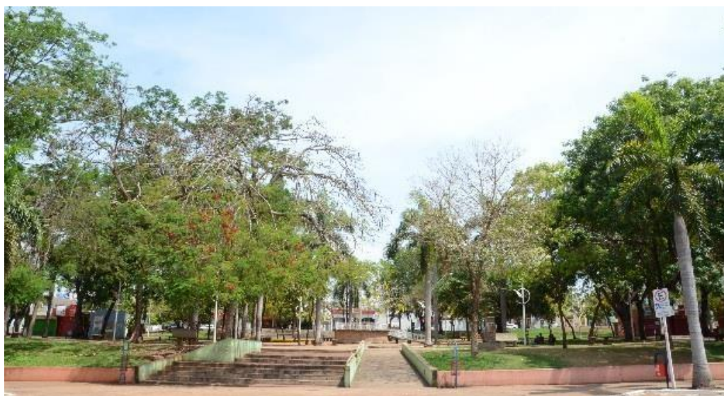
Figura 1: Praça Brasil, Rondonópolis MT

Marx (1980) Observa, portanto, sobre as praças, que ao longo da história urbana brasileira, tiveram papéis diferentes perante a sociedade. Vezes civicamente, vezes militarmente, os logradouros eras destaques nas cidades pelas funções que obtinham. Durante um longo tempo, tais funções traziam o significado desses espaços públicos, que eram símbolos do estado e do religioso. O mesmo diz que por mais raras que as praças poderiam ser, eram marcantes, e surgiram em pequena quantidade e representam até hoje símbolos da história política do país.