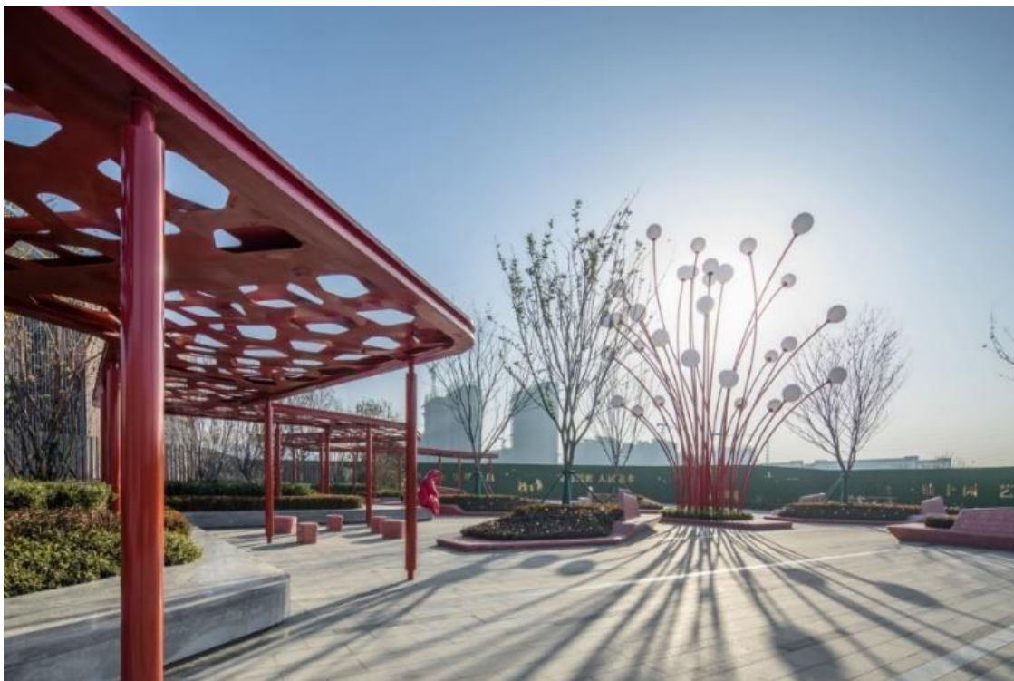
Figura 14: Hefei Wantou & Vanke Paradise Art Wonderland China