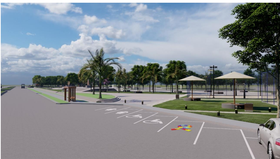
Figura 24: Estacionamento e ponto de ônibus

Na figura 24, mostra algumas vagas de estacionamento destinadas a idosos, cadeirantes e autistas. Ponto de ônibus de madeira e as quadras locadas em pontos estratégicos seguindo a modulação da praça.