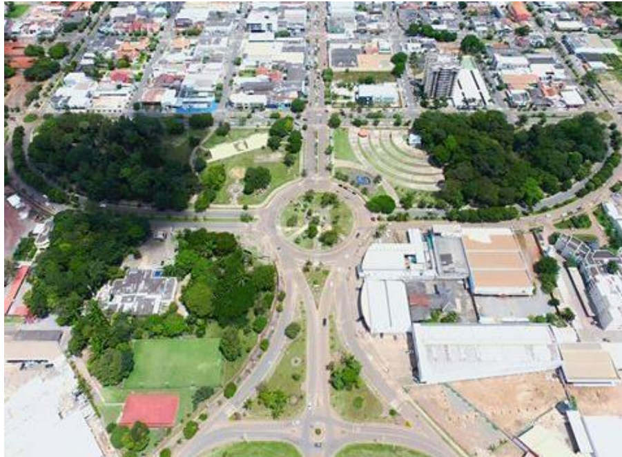
Figura 12: Praça da Bíblia vista de cima

Segundo De Angelis (2005), o significado da praça pública desmoronou com o tempo, as feições perdidas, a solidão, o esvaziamento de praças e rivais anômalos como ponto de encontro estão entre os outros centros comerciais, pois mesmo através do ambiente artificial desafia e reproduz aspectos da natureza em um mundo de capitalismo selvagem, onde o ser humano é capaz de atrair sua atenção para um ambiente economicamente desfavorecido em entretenimento estressante que resulta da vida urbana.