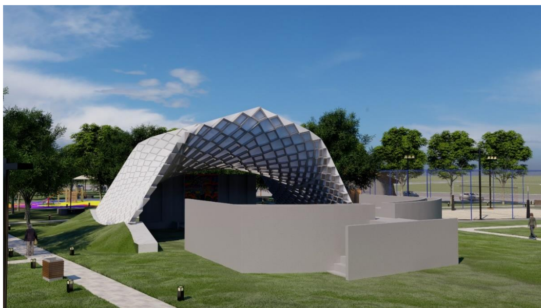
Figura 30: Palco para shows

Vista em perspectiva do palco e espaço para shows , contendo arquibancada para 130 (cento e trinta) pessoas. Com uma cobertura ondulada em acm vermelho e bege, parede traseira com volumes diferentes e uma pintura do artista Rafael Jonnier.