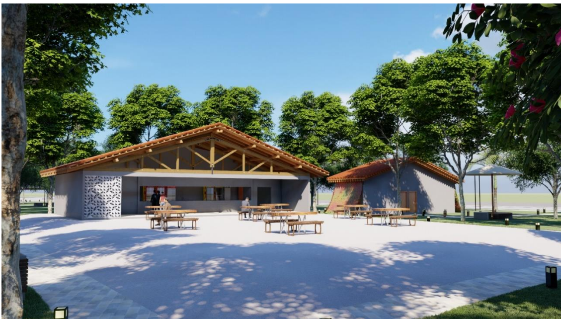
Figura 27: Praça de alimentação

Figura 27, mostra um ângulo da praça de alimentação que é acessada por uma única rampa frontal, e talude nas laterais, um espaço para interação, com uma vegetação alta ao redor auxiliando no conforto térmico.