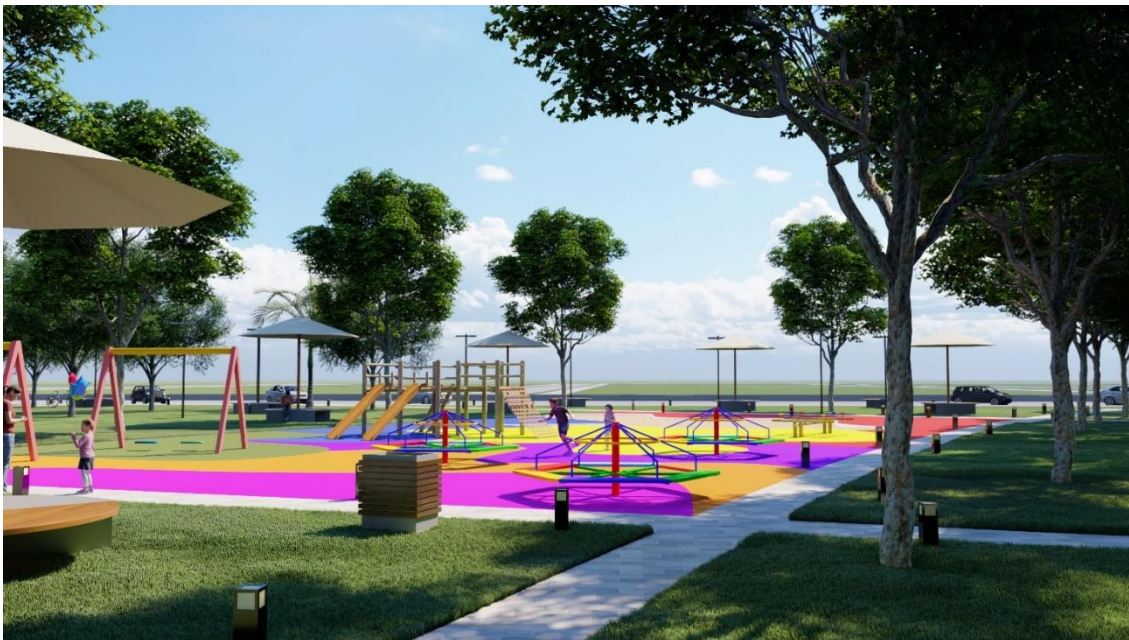
Figura 29: Playground

Playground com piso colorido , um espaço para areia , destinados as crianças contendo brinquedos interativos e quiosques com bancos ao redor dando apoio ao playground para os pais e cuidadores vigiarem as crianças.