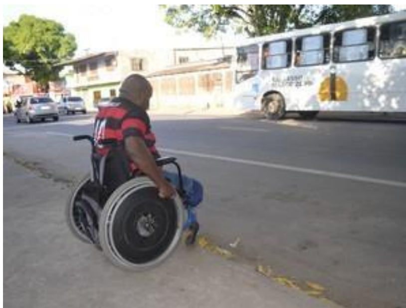
Figura 3: Macapá - AP

A acessibilidade, faz muita falta em vários pontos da cidade de Sinop, inclusive em locais públicos, e quando implantadas as mesmas ficam em situações bem precárias pela falta de atenção que é dada e a não manutenção, além de limitações que os usuários podem sofrer com os meios de comunicação que os comerciantes podem colocar nas calçadas, questões que para pessoas que não tenham restrições de locomoção passam despercebidas, mas para os cadeirantes, idosos, e pessoas com dificuldades sensoriais se transformam em grandes problemas, isso acaba diminuindo drasticamente a qualidade de vida que todos deveriam ter (MACEDO e ROBBA).