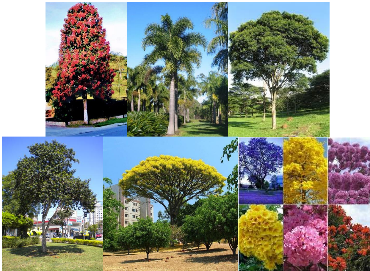
Figura 20: Espécies utilizadas

espaço para contemplação. De forma geral, o plantio foi idealizado de modo a proporcionar alternância de floração durante todo o ano.