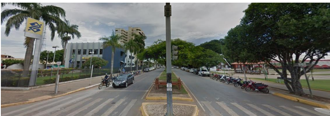
Figura 8: Banco do Brasil