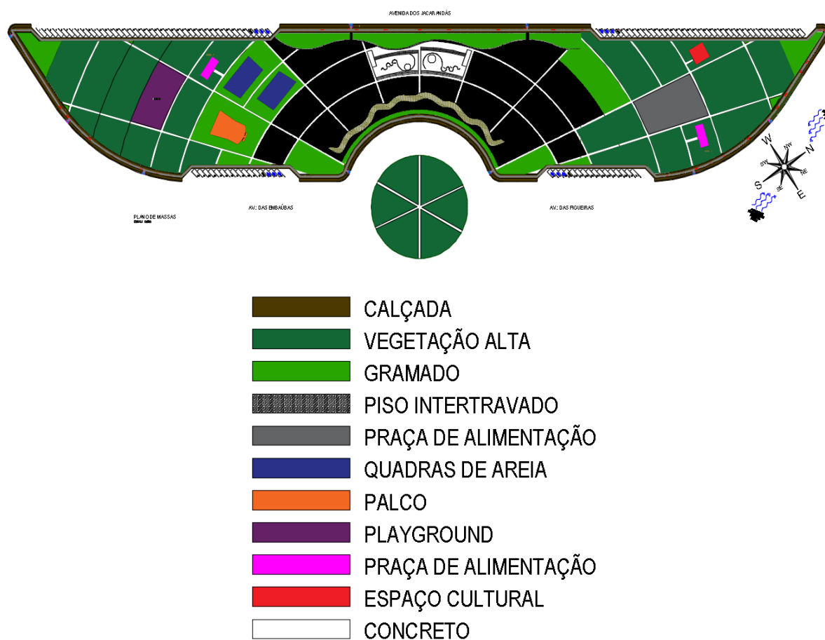
Figura 18: Plano de Massa