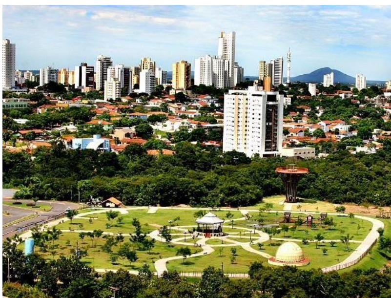
Figura 15: Parque Mãe Bonifácia Cuiabá - MT

No lugar, observa-se que há uma vegetação típica do cerrado, especialmente durante a floração. Os visitantes também podem ver alguns dos animais do cerrado, como saguis, cutias, gambás, cobras e várias espécies de aves, em seu ambiente natural, nas árvores ou nos caminhos que atravessam o parque.