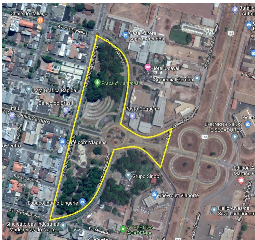
Figura 7: localização da praça da bíblia na cidade de Sinop-MT