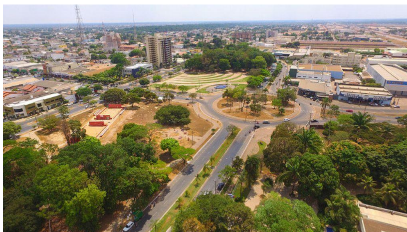
Figura 11: Praça da Bíblia vista de cima

De acordo com Santos (1997), a palavra paisagem é frequentemente usada em vez do termo configuração territorial. Este é um conjunto de elementos naturais e artificiais que caracterizam fisicamente uma área. Assim, neste contexto, há lugares onde a paisagem precisa ser avaliada e seus espaços bem estruturados e planejados.