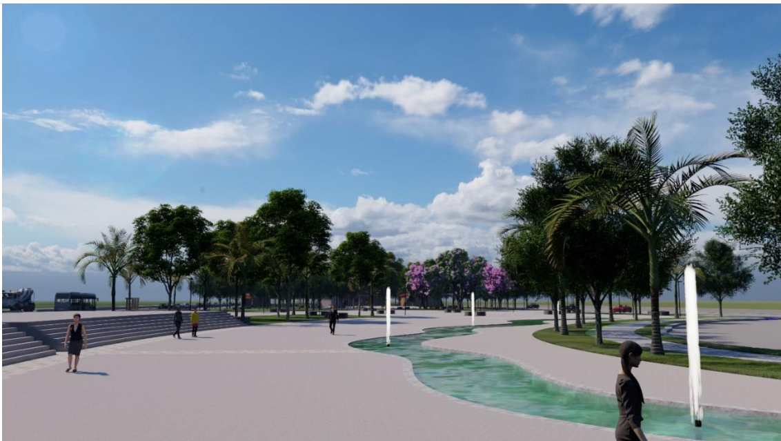
Figura 23: Área descoberta Praça da Bíblia

Foi projetado um lago em um local estratégico com pontos de jatos d'água, auxiliando a diminuição da ilha de calor que possa vir ocorrer na praça.