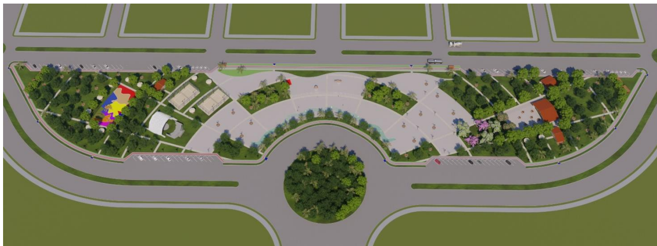
Figura 21: Implantação Praça da Bíblia