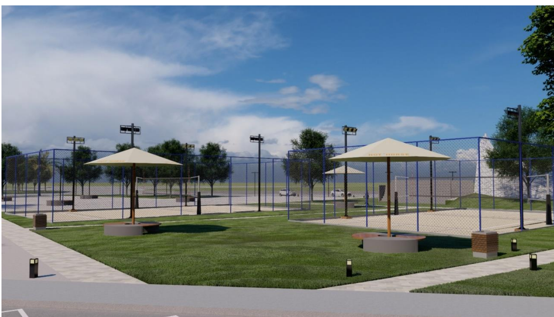
Figura 28: Quadras de areia

Figura 28, imagem mais próxima das quadras de areia com os bancos e gramado ao redor.