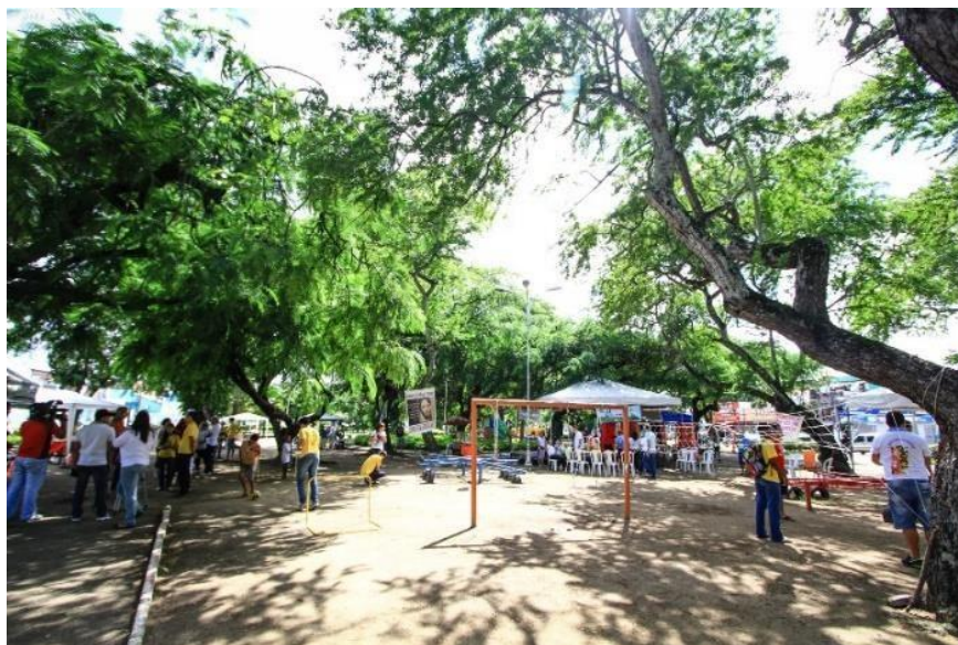
Figura 2: Praça do centenário

Segundo Marx (2000) o problema ambiental está piorando pois é o local onde grande parte da população se concentra, as cidades estão se tornando cada vez mais importantes pela sua alta porcentagem de expansão, mas acaba sendo excedente de recursos naturais, pela concentração de pessoas. O ambiente é moldado pelo sistema natural e sistema antrópico, ele não funciona como ambiente fechado onde encontra tudo que necessita, mas sim como um sistema aberto dependente das características ambientais. E as mudanças da construção civil removendo a cobertura vegetal para construção de estradas sem planejar os espaços a serem alterados traz grandes consequências para seus ocupantes.