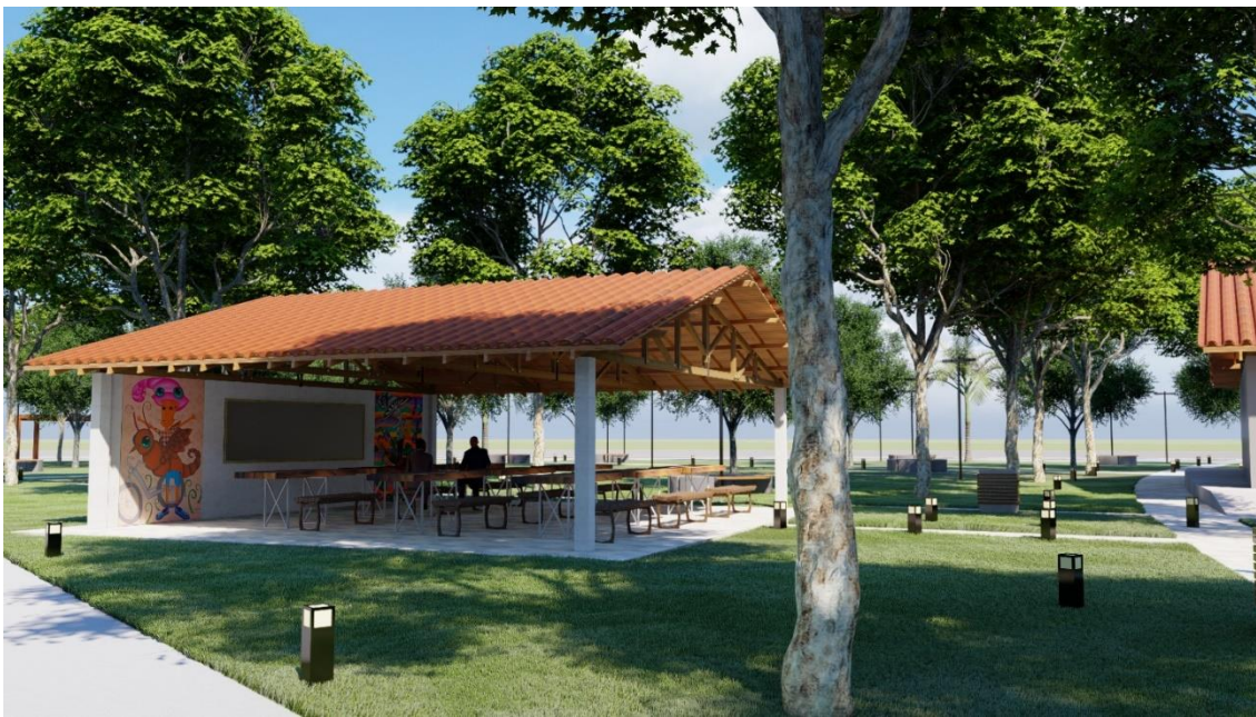
Figura 25: Espaço cultural Praça da Bíblia

Figura 25, espaço cultural com mesas e bancos em madeira, o telhado aparente em madeira, parede com quadro lousa, pinturas localizadas nas extremidades do artista Rafael Jonnier da cidade de Cuiabá, ele é conhecido por pinturas da que relembram a pop art mas sempre com características regionais.