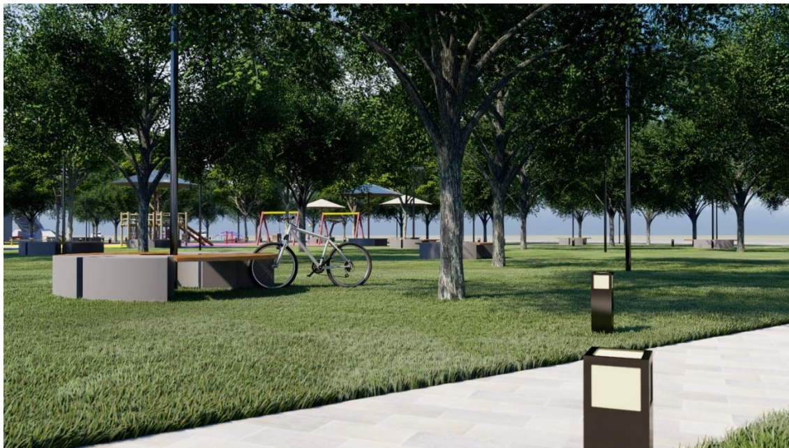
Figura 22: Passeio Praça da Bíblia

Na figura 22, é possível perceber em destaque os passeios, que foram incluídos com o intuito de incentivar caminhadas pelo meio do bosque promovendo assim um considerável fluxo de pessoas na praça, e a vegetação foi preservada e complementada para realçar ainda mais o local. Pode-se analisar também o modelo do banco feito para a praça em questão.