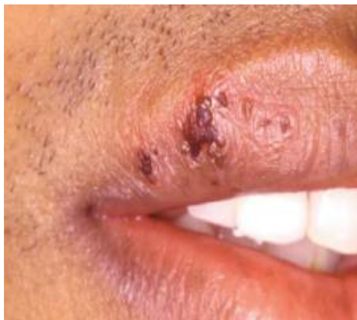
Figura 6 - Período clínico reparatório da manifestação do herpes simples recorrente na pele peribucal e semimucosa labial

Em 24 a 48 horas, as úlceras se transformam em crostas (Figura 6), que eventualmente se curam completamente em cerca de 8 a 10 dias. Infecções secundárias pelo HSV-1, ou recorrentes, ocorrem quando o vírus é reativado, embora muitos pacientes possam ter apenas uma infecção assintomática na saliva (ARDUINO; PORTER, 2006).