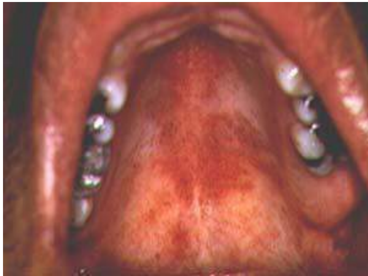
Figura 2 - Candidíase eritematosa na mucosa de palato