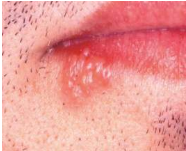
Figura 5 - Período clínico ativo da manifestação do herpes simples recorrente na pele peribucal e semimucosa labial