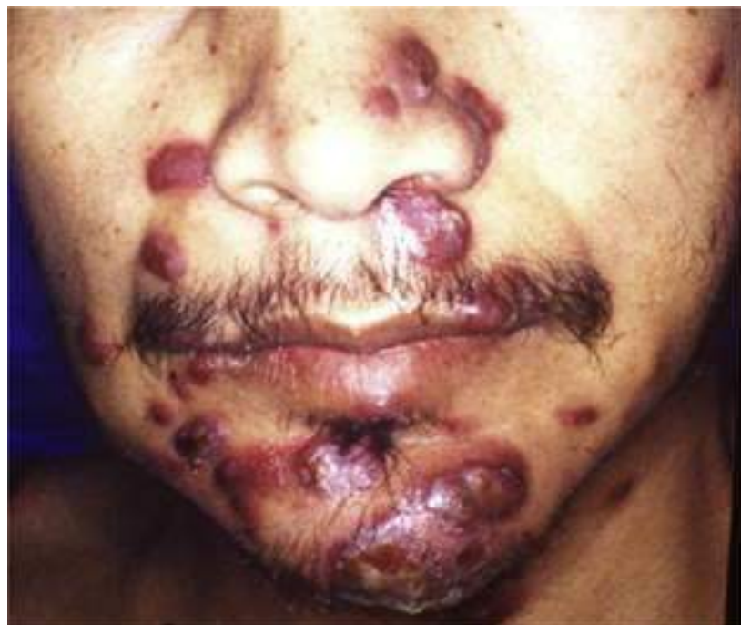
Figura 10: Sarcoma de Kaposi em tegumentos faciais; Nódulos cutâneos marrons coalescentes em paciente masculino na 3ª década de vida.

Além disso, as lesões podem ter um impacto psicossocial significativo nos pacientes, afetando sua autoestima e qualidade de vida. A estigmatização social associada às manifestações visíveis do sarcoma de Kaposi pode levar a um isolamento emocional e dificuldades na interação social. Portanto, além dos desafios clínicos, é crucial fornecer apoio psicossocial abrangente para os pacientes afetados por essa condição, visando promover seu bem-estar holístico (EPSTEIN; CABAY RJ; GLICK M, 2005).