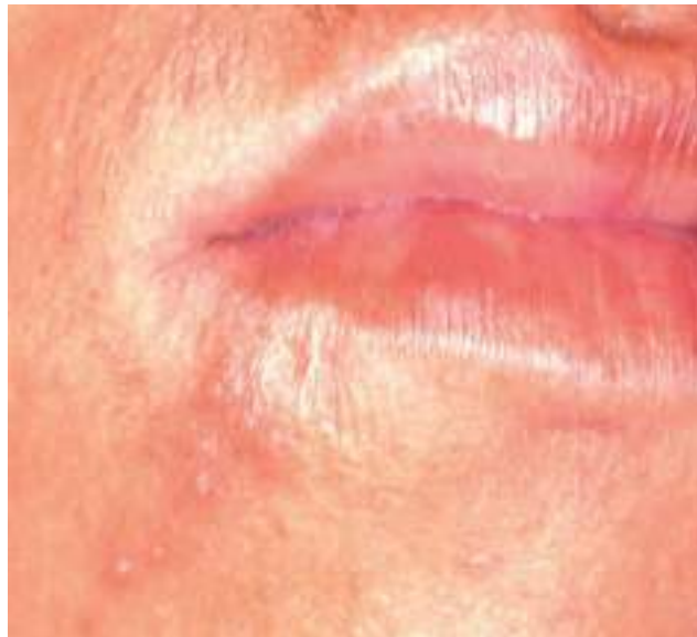
Figura 4 - Períodos clínicos prodrômico da manifestação do herpes simples recorrente na pele peribucal e semimucosa labial

Após a infecção, na fase prodrômica (Figura 4) , os primeiros sintomas relatados incluem coceira, queimação e vermelhidão em um lado da face. Esses sintomas costumam surgir de 6 a 24 horas antes do aparecimento visível das lesões da doença. As lesões geralmente não se estendem além da linha média da face e se manifestam apenas no lado afetado (RODRIGUES,2021).