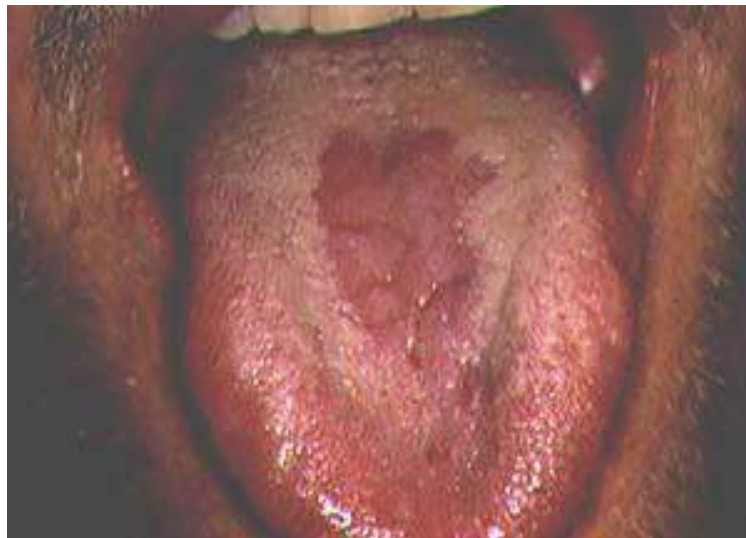
Figura 3- Candidíase na superfície dorsal da língua.