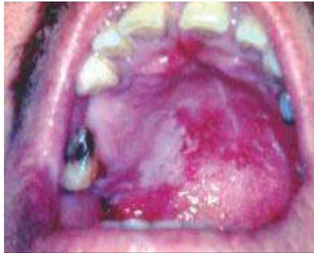
Figura 1 - Candidíase pseudomembranosa na mucosa bucal

gênero Candida , que pertence à família Cryptococcaceae . O gênero Candida possui 81 espécies reconhecidas, sendo a Candida albicans a mais prevalente e conhecida. Pacientes com HIV frequentemente desenvolvem infecções fúngicas devido às mudanças profundas na função imunológica mediada pelos linfócitos T, resultando em uma redução na imunidade (MANGUEIRA, 2020; CAVASSINI, 2019).