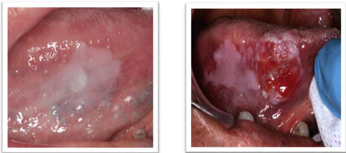
Figura 8 – Leucoplasias orais homogêneas e não homogêneas

Suscedendo o assunto de lesões, a Leucoplasia Pilosa Oral (LPO) é considerada um marcador clínico confiável da progressão do HIV em indivíduos infectados, ocorrendo em cerca de 12% dos casos. Essa condição é causada pelo vírus Epstein-Barr (EBV) latente e sua presença em pacientes com HIV indica um estágio avançado da doença. A LPO (figura 8) se apresenta como placas onduladas esbranquiçadas nas bordas laterais da língua, que não podem ser removidas por raspagem, podendo ocorrer unilateral ou bilateralmente (PAULIQUE et al. 2017).