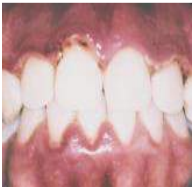
Figura 7 - Gengiva marginal e papilar ulcerada e manutenção periódica preventiva após 4 meses do término do tratamento.

As lesões bacterianas associadas às infecções pelo HIV incluem condições como gengivite e periodontite de rápida evolução. A imunossupressão decorrente da contaminação com o vírus da AIDS leva a alterações na microbiota oral (Figura 7) , favorecendo o desenvolvimento de lesões gengivais e periodontais (DOMINGUEZ FILHO et al. 2021).